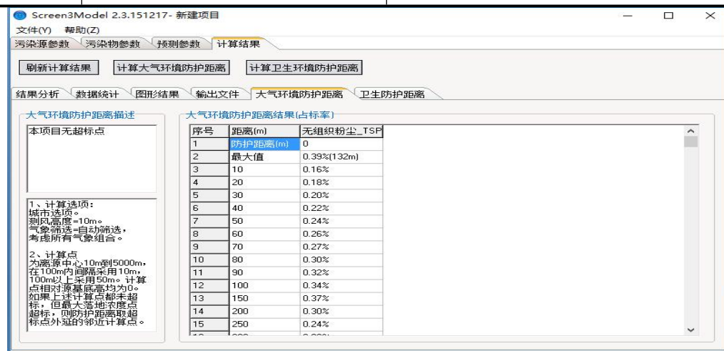
图 7-1 无组织粉尘排放大气防护距离计算截图