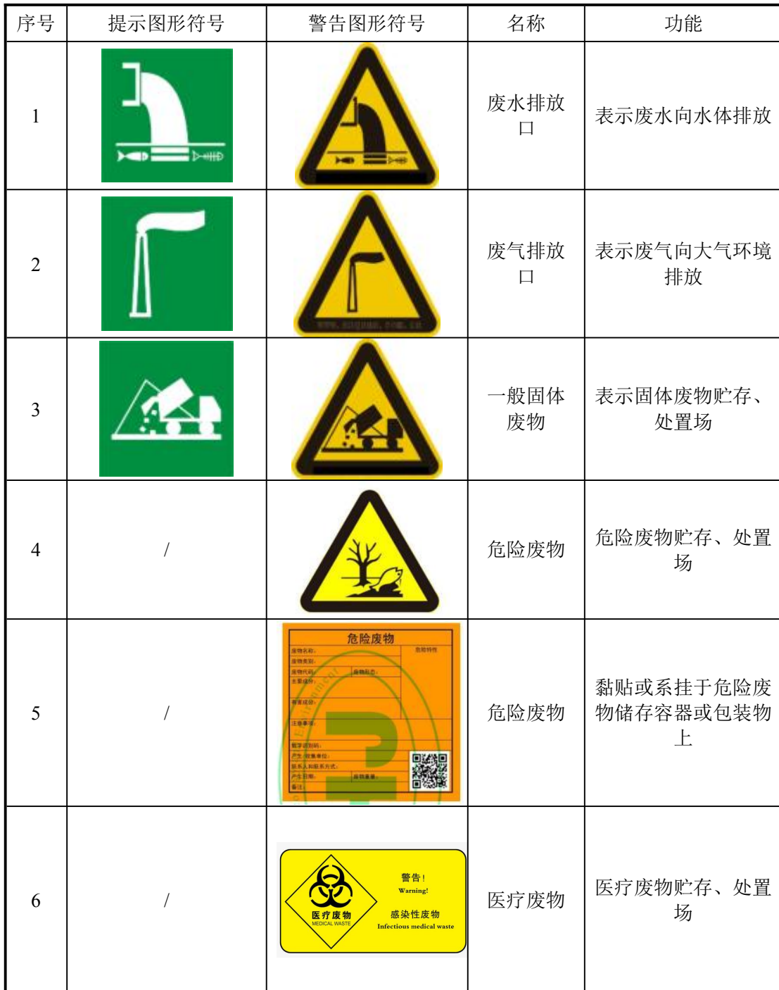
表 4-15 环境保护图形符号一览表

污染物排放口设置提示性环境保护图形标志牌；医疗废物贮存场所应按《医疗废物专用包装袋、容器和警示标志标准》（HJ421-2008）规定，统一设置标识标牌。