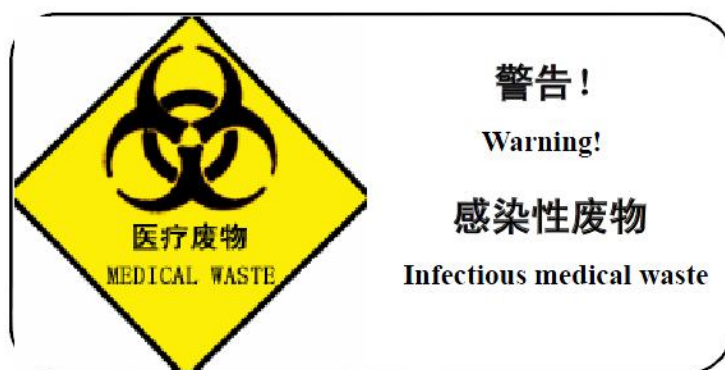
图 4-2 带警告语的警示标志

包装袋不得使用聚氯乙烯（PVC）塑料为制造原料。包装袋最大容积 0.1m 3 ，大小和形状适中，便于搬运和配合周转箱（桶）盛装。包装袋的颜色为黄色，并有盛装医疗废物类型的文字说明，如盛装感染性废物，应在包装袋上加注“感染性废物”字样。包装袋上应印刷医疗废物警示标志，带警告语的警示标志及危险废物标志见下图。