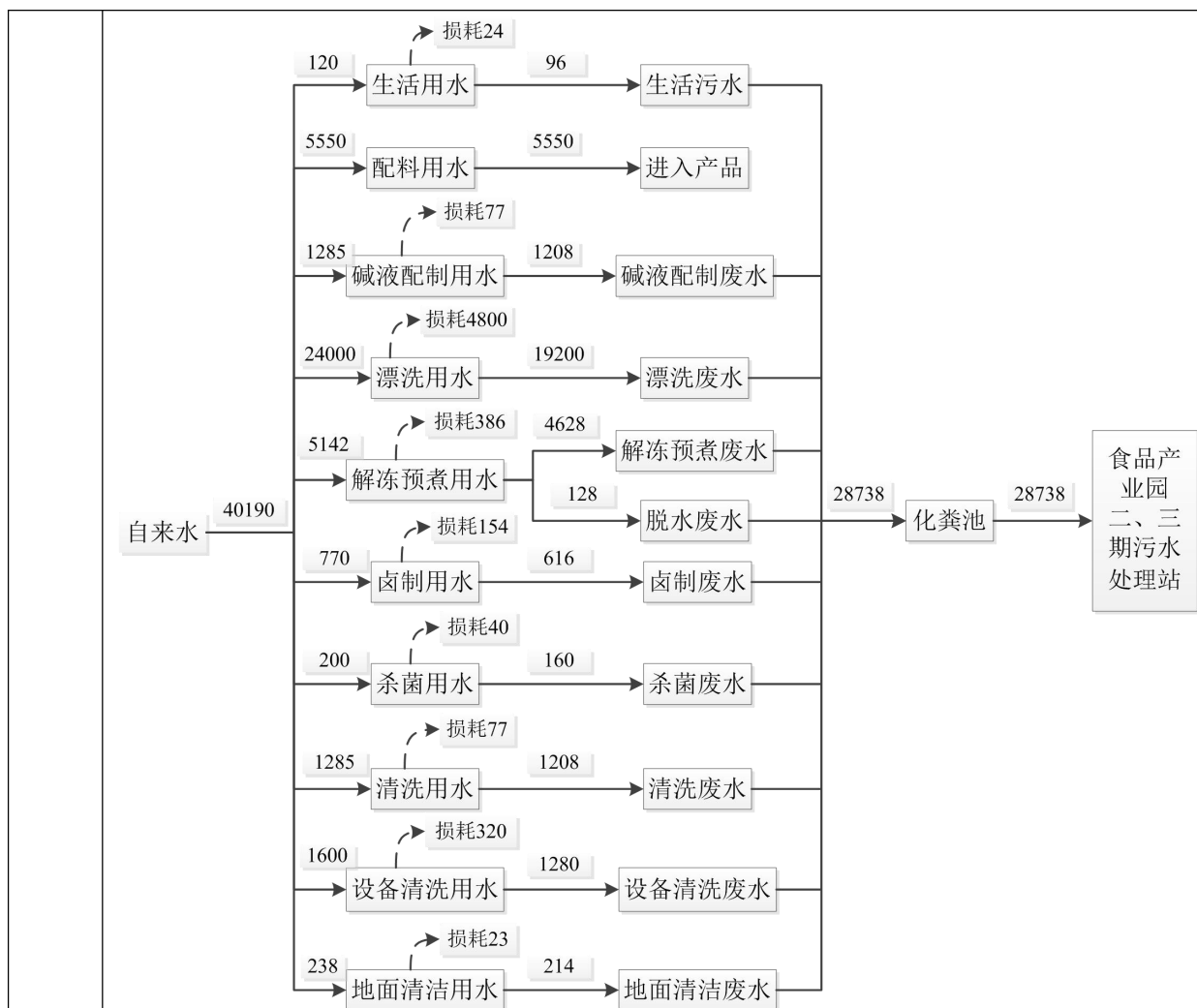
图 2-1 项目水平衡图 (单位: m³/a)