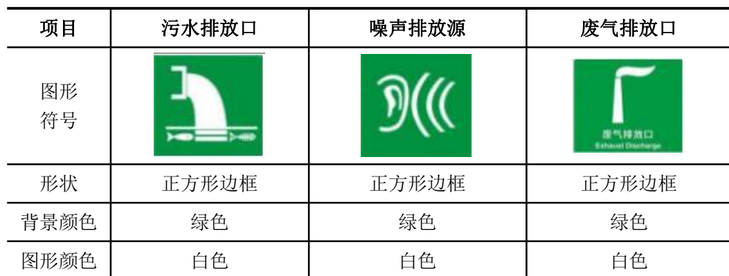
表 5-2 各排污口（源）标识牌设置一览表

建设单位应如实填写《中华人民共和国规范化排污口标志登记证》的有关内容，由生态环境主管部门签发登记证。建设单位应把排污口情况如排污口的性质、编号、排污口的位置以及主要排放的污染物的各类、数量、浓度、排放规律、排放去向以及污染治理实施的运行情况建档管理，并报送环保主管部门备案。建设单位应该在排放口处设立或挂上标志牌，标志牌应注明污染物名称以警示周围群众，执行《环境图形标准排污口（源）》（GB15563-1995），详见下表。