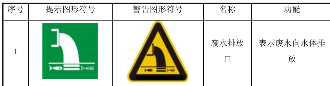
表 4-15 环境保护图形符号一览表

废气排放口、水污染物排放口和固体废物堆场应按《环境保护图形标志—排污口（源）》（GB15562.1-1995）规定，设置统一制作的环境保护图形标志牌，污染物排放口设置提示性环境保护图形标志牌；医疗废物贮存场所应按《医疗废物专用包装袋、容器和警示标志标准》（HJ421-2008）规定，统一设置标识标牌。