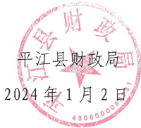
附表：2024 年部门预算批复表

有下属单位的部门要严格按照有关要求，积极做好下属单位预算批复工作，在收到 2024 年部门预算批复后 15 日内将部门预算分解下达到基层单位，不得随意调整，同时要将批复基层单位预算的文件抄送财政局对口业务股室和预算股备核。