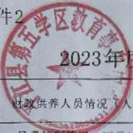
2023年度部门整体支出绩效评价基础数据表